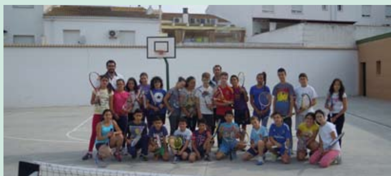
Alumnos 6º curso Colegio San Bartolomé