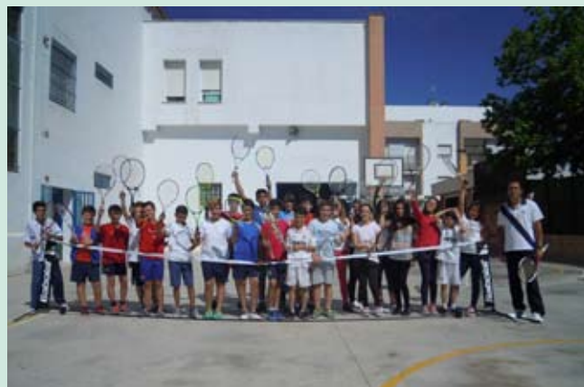
Alumnos 5º curso Colegio Cristo Rey