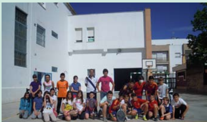
Alumnos 6º curso Colegio Cristo Rey