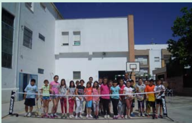
Alumnos 5º curso Colegio Cristo Rey

Esta iniciativa fue posible gracias al profesorado de ambos centros educativos y será extensible a otros colegios de la ciudad.