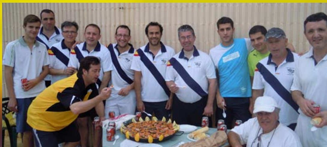
Comida de convivencia