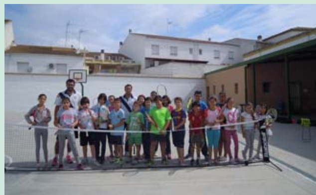
Alumnos 5º curso Colegio San Bartolomé